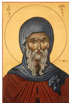
Saint Antoine le Grand

En 312, Antoine s'éloigne davantage pour s'isoler. Il va en Thébaïde, sur le mont Qolzum (où se trouve aujourd'hui le monastère Saint-Antoine). Antoine donne à ses visiteurs des conseils de sagesse, les invitant à la prière plutôt qu'à la violence. Il est considéré comme le créateur du premier monastère. On le présente souvent comme le père de tous les moines. Saint Antoine mourra à l'âge de 106 ans.