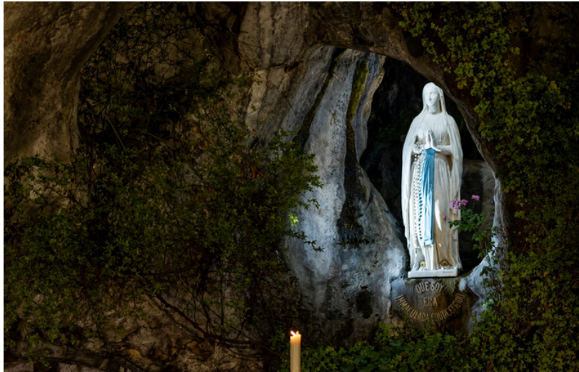
Notre Dame de Lourdes fêtée le 11 février